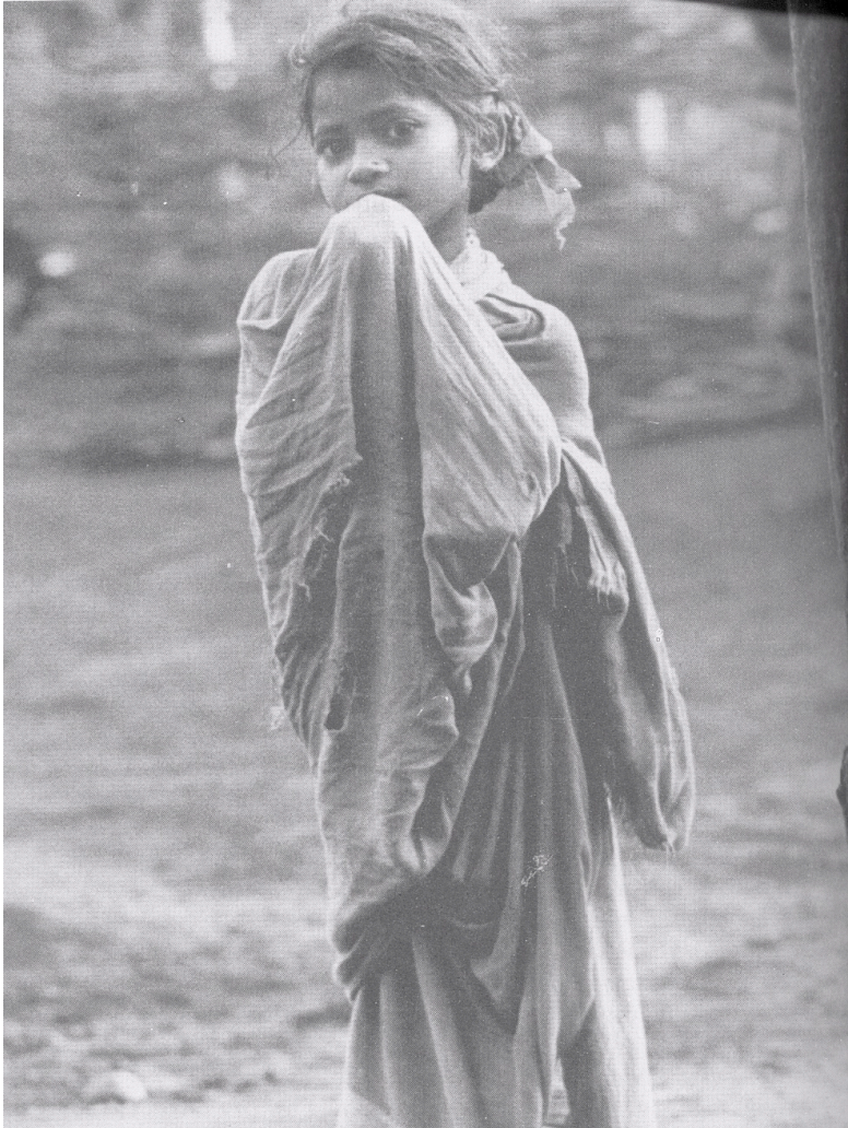
(ਪੂੜ ਵਿੱਚ ਖਿੜ੍ਹਿਆ ਫੁੱਲ)

ਵਾਲੀ ਅਸਮਾ ਜਹਾਂਗੀਰ ਅਤੇ ਹਿੰਦੁਸਤਾਨ ਤੋਂ ਪੱਤਰਕਾਰ ਕੁਲਦੀਪ ਨਈਅਰ ਨੂੰ ਬੁਲਾਇਆ ਗਿਆ। ਇਸ ਹੀ ਸਮੇਂ ਹਰੀ ਸ਼ਰਮਾ ਨੇ 23 ਅਕਤੂਬਰ